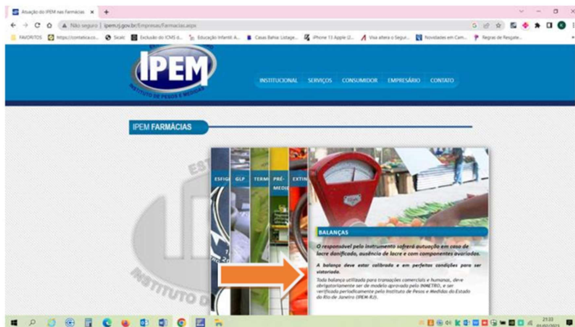
Figura 1 (Disponível no endereço: https://patobranco.pr.gov.br/licitacao/edital-de-pregao-eletronico-no-05-2025-processo-no-05-2025-compra-eletronica-no-90005-2025/ )

O INMETRO/IPEM ADVERTE CLARAMENTE INCLUSIVE EM SEU WEBSITE: