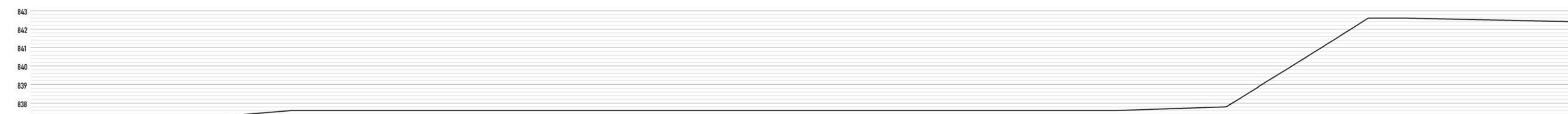
PERFIL NATURAL DO TERRENO esc: 1/200