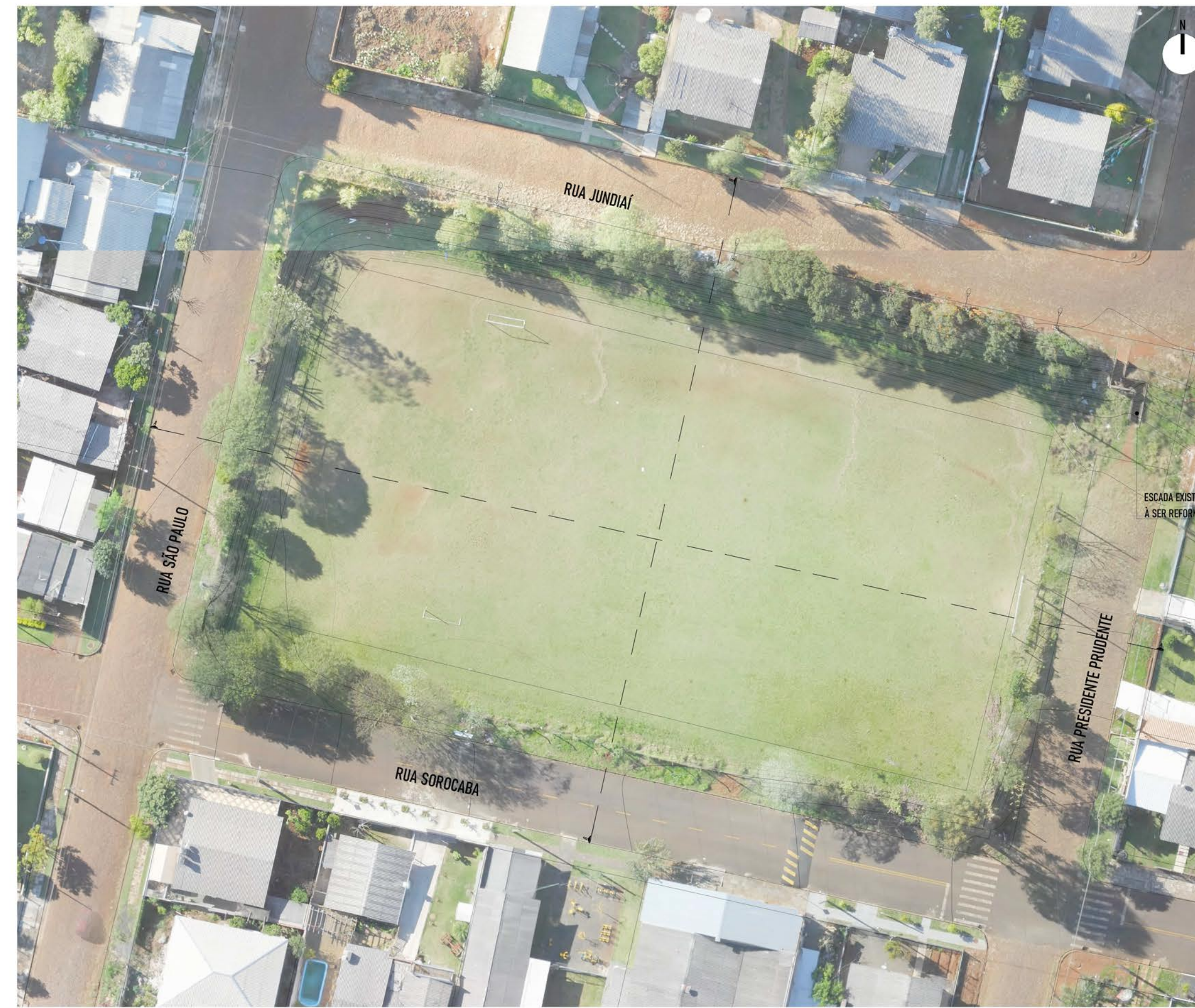
PLANTA DE CURVAS RETIFICADAS esc: 1/500