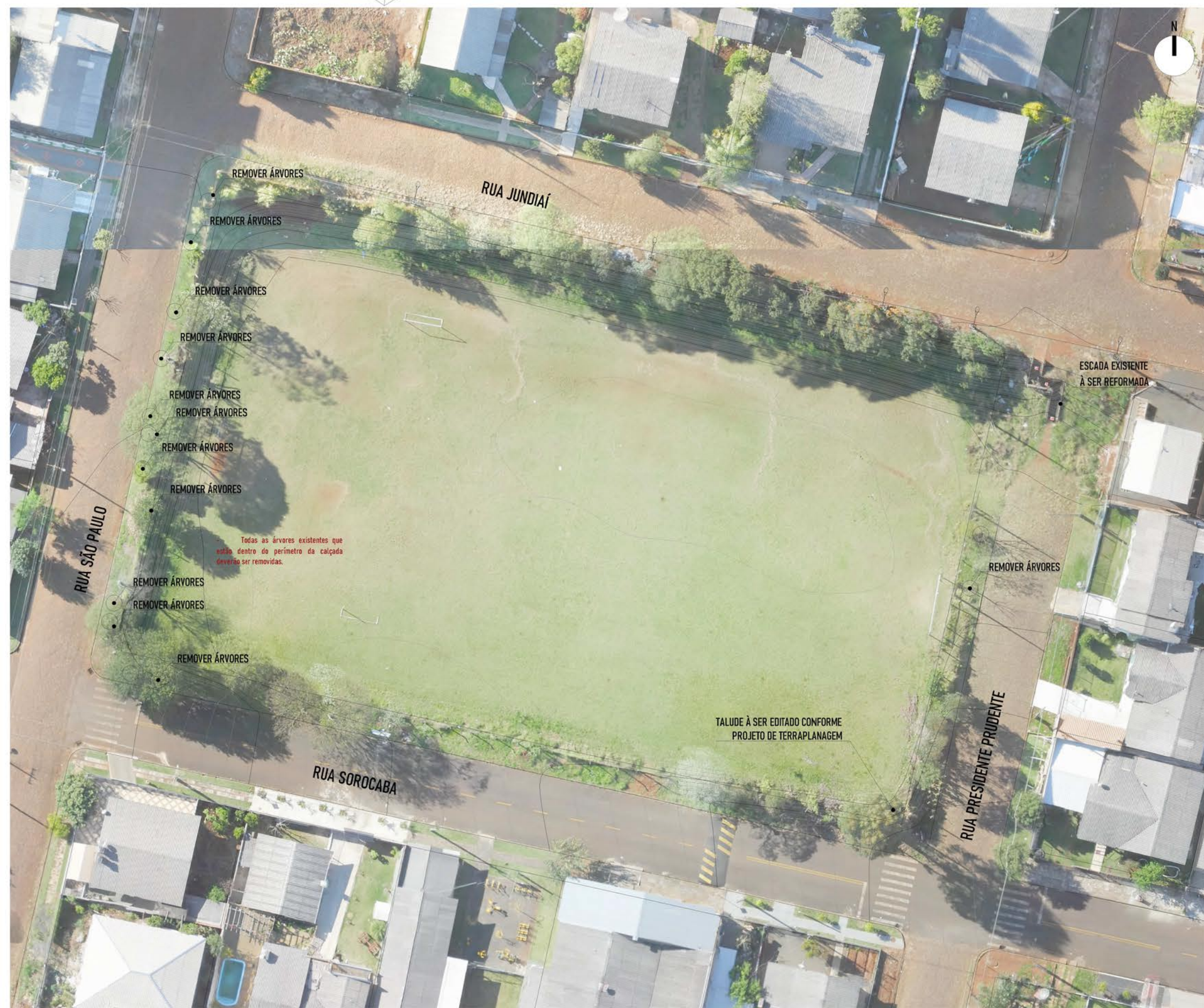
PLANTA DE CURVAS ORIGINAIS E DEMOLIÇÃO esc: 1/500