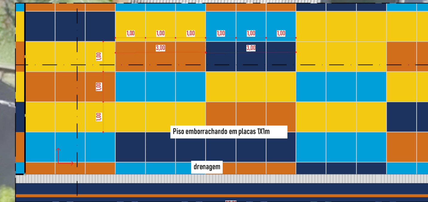
DETALHE DE PISO 01 ESC:1/75