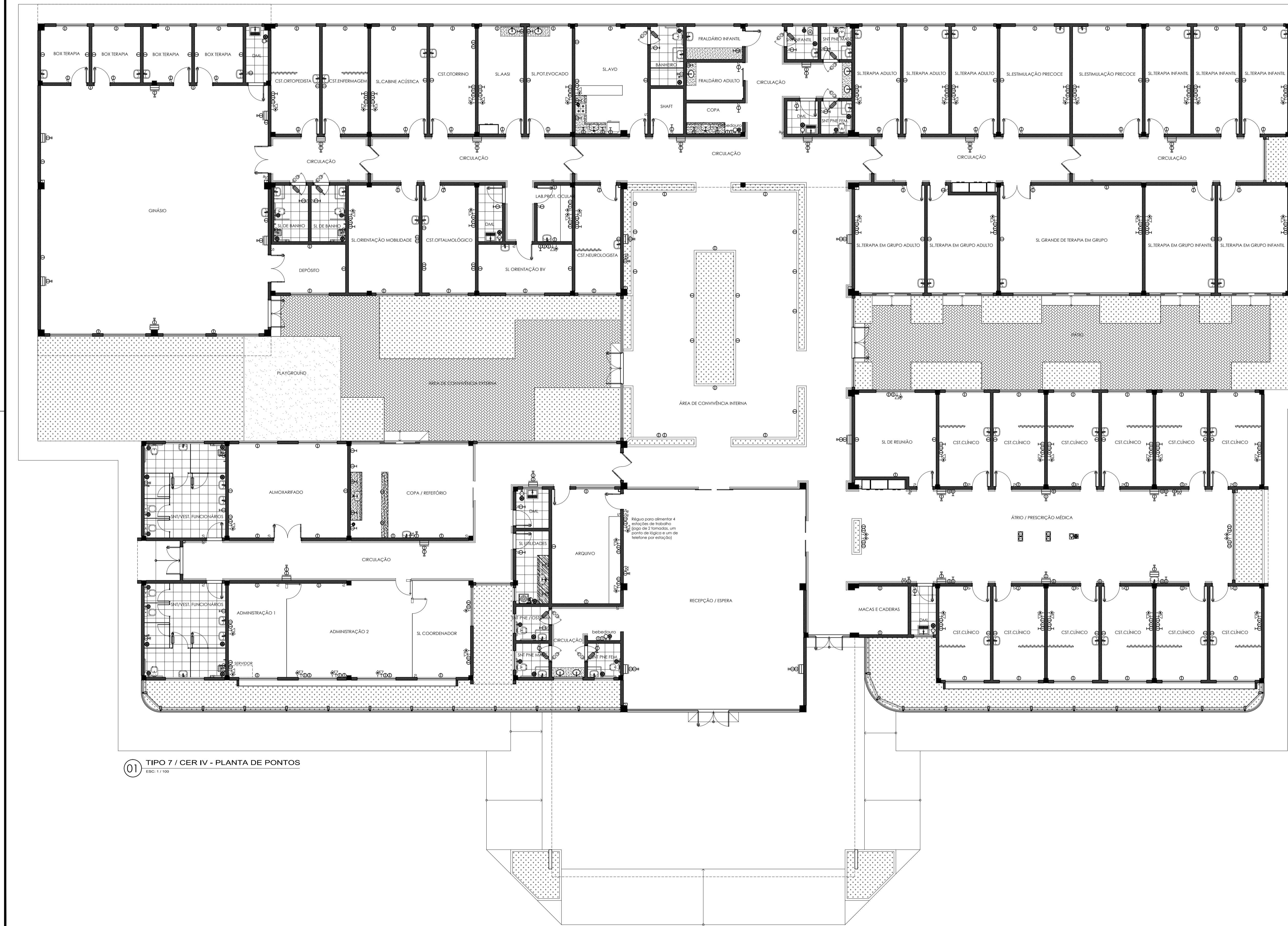
01 TIPO 7 / CER IV - PLANTA DE PONTOS ESQ: 1 / 100