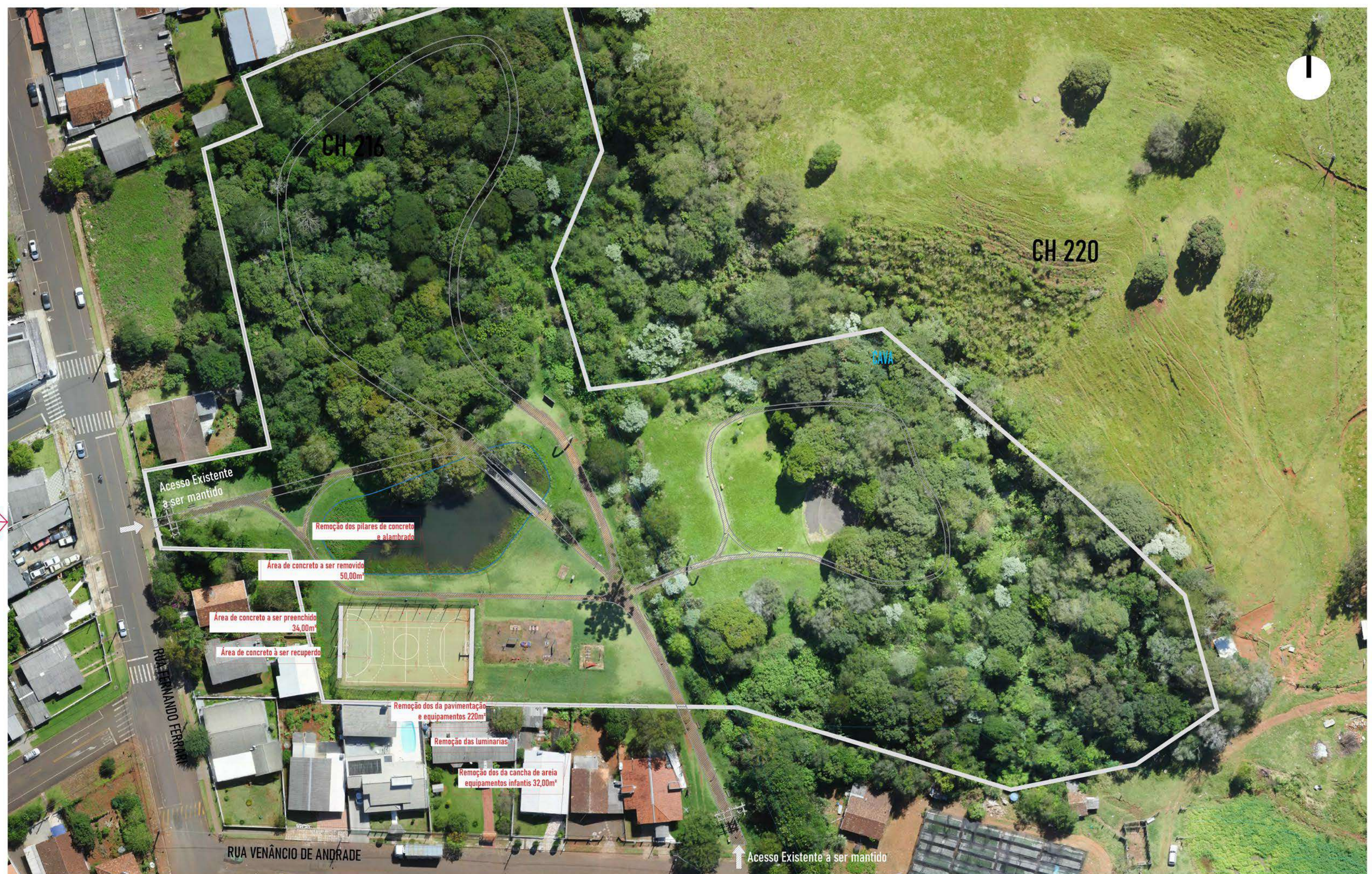
PLANTA DE DEMOLIÇÃO esc:1/750