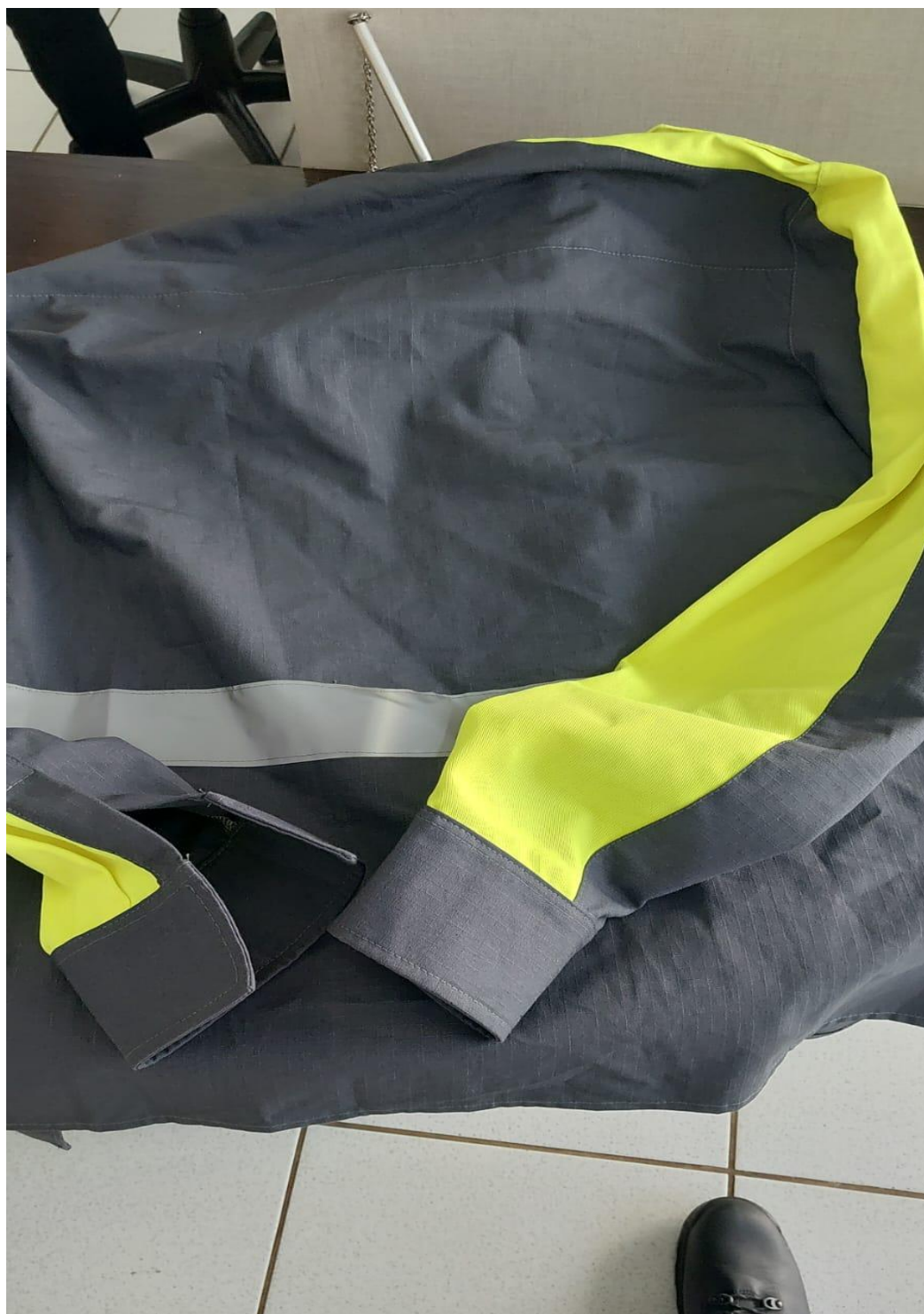
CAMISA MANGA LONGA

Rua Tapir, 1161 • 85.501-046 • Pato Branco/PR 46. 3220-1544 • www.patobranco.pr.gov.br