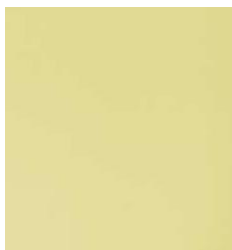
Figura 2- Pintura acrílica cor amarelo dália