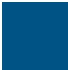
Figura 2- Pintura acrílica cor azul marinho