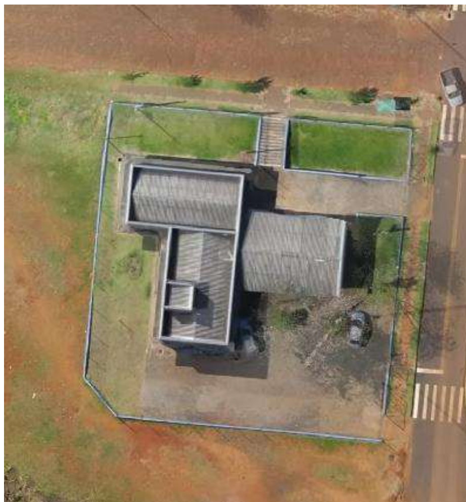
Imagem 1 - Imagem aérea da unidade básica de saúde Novo Espero